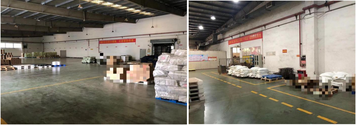
图一 现有仓库实景图

本次采购项目为佛山佛塑科技集团股份有限公司在现有的来保利公司厂区钴源仓库基础上增加夹层钢结构平台以扩充现有仓库仓储面积，现有仓库实景图见图一，规划设计方案图见图二，仓库改造增加夹层钢结构平台分为平台一、平台二计算总面积约 670 平方米。